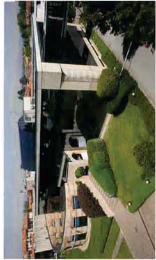
Die Firmenzentrale in Sovico in der Nähe von Monza.