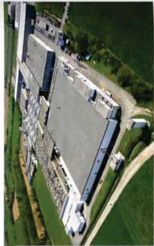
Das Hauptwerk des Unternehmens liegt im italienischem Pontirolo Nuovo.