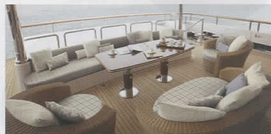
Con il tessuto Tempotest Home vengono realizzati gli arredi degli yacht più esclusivi, dove la qualità è sempre al primo posto.