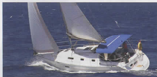
Il tendalino della barca a vela è sempre esposto al sole e al vento e spesso "maltrattato". Per lui è fondamentale un tessuto resistente.

La gamma di prodotti Tempotest Marine si adatta a ogni tipo di imbarcazione vela e motore e per ogni applicazione, come la copertura delle vele a sinistra. Si usa un materiale impermeabile e traspirante che evita il formarsi di muffe e protegge dai raggi ultravioletti.