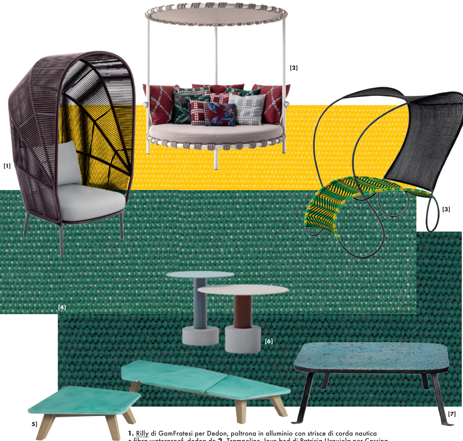
1. Rilly di GamFratesi per Dedon, poltrona in alluminio con strisce di corda nautica e fibra waterproof. dedon.de 2. Trampoline, love bed di Patricia Urquiola per Cassina, in acciaio verniciato, corda hand woven e tela idrorepellente. cassina.com 3. Modou di Ron Arad per la collezione M'Afrique di Moroso, in acciaio verniciato e fili in polietilene colorato intrecciati. moroso.it 4. Solids, tessuti outdoor di Tempotest Home by Parà, con finissaggio Teflon Extreme per resistere a intemperie e muffe. para.it 5. Rafael firmata Paola Navone per Ethimo, coffee table in teak con piani in pietra lavica a smalto smeraldo o marmo, in due misure. ethimo.com 6. Roll di Patricia Urquiola per Kettal, tavolini in cemento e alluminio con top smaltati, oppure in teak o marmo. kettal.com 7. Ischia design Paola Navone per Baxter, low table in metallo nero forgiato con top in pietra lavica smaltata turchese, anche naturale o in palladiana. baxter.it

GORDON GUILLAUMIER Firma per Roda la sedia da regista Orson, in massello di teak con dettagli in acciaio lucido. Il designer maltese, con studio a Milano, reinterpreta in chiave contemporanea la più classica delle sedute outdoor e le dona una nuova estetica, rivestendola anche sui lati in Batyline: lo stesso tessuto tecnico che forma seduta e schienale. rodaonline.com