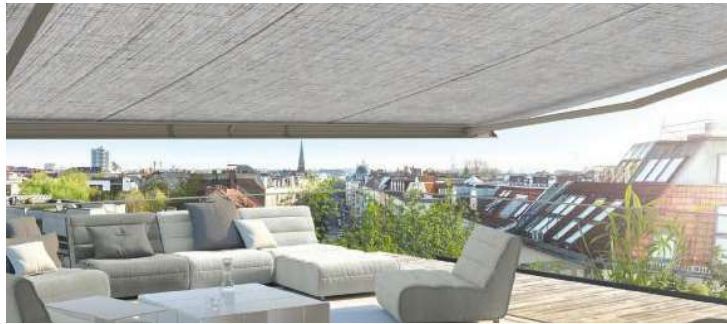
Tempotest® Starlight blue è la prima collezione al mondo di tessuti per la protezione solare in Pet riciclato e certificata GRS

Dallo scorso primo febbraio, la collezione Centenario TEMPOTEST® è online.