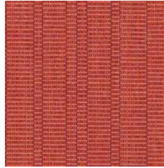
Modello 2. Micro to Macro