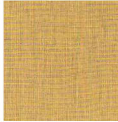
Modello 3. Seta cruda