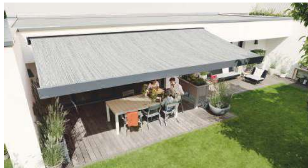
Tempotest® Starlight blue XL, il primo tessuto sostenibile al mondo in versione grande altezza (325 cm)

Si tratta di una collezione di tessuti per tende da sole dal design moderno e dalla qualità unica, realizzati attraverso un processo sostenibile che permette un risparmio energetico del 60%, il 45% di emissioni in meno di Co2 e una riduzione del consumo d'acqua del 90%. 32 tessuti in altezza 120 cm e, novità as-