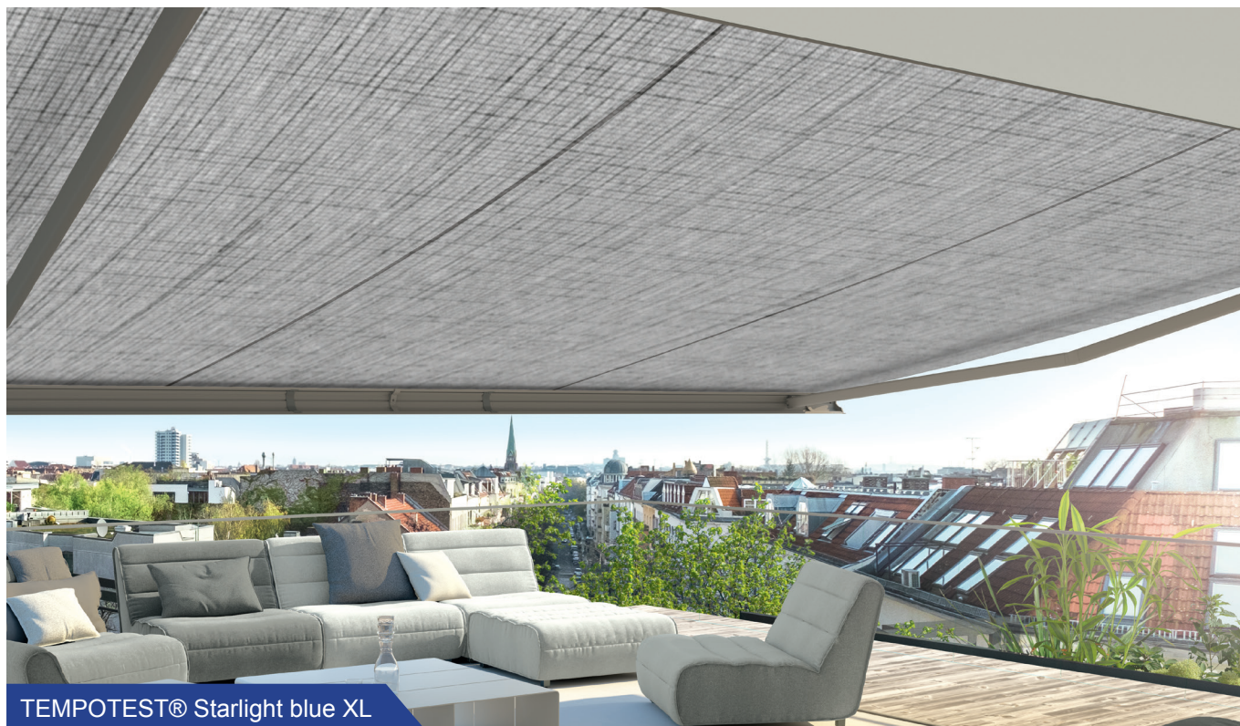
TEMPOTEST® Starlight blue XL