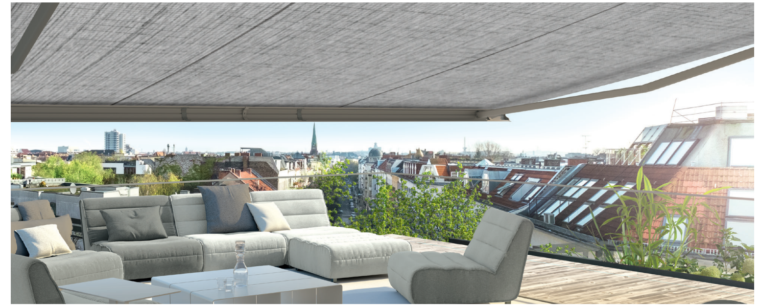
Het prijswinnende TEMPOTEST Starlight blue zonweringsdoek toont aan hoe betrokken Parà is bij duurzaamheid.