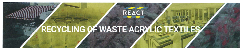
Parà Tempotest ist nun in das europäische REACT-Projekt involviert.