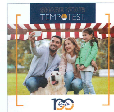
Geburtstagsaktion: Parà bittet Markisennutzer um ganz spezielle Fotos.

Seit 1921 fertigt Parà hochwertige Gewebe u.a. für den Sonnenschutz. In Vorfreude auf den 100. Geburtstag im nächsten Jahr lädt das italienische Familienunternehmen, das mittlerweile in dritter Generation besteht, alle Tempotest-Freunde zu einer besonderen Aktion im Internet ein, an der sie sich bis zum Jahresende beteiligen können. Mit Share your Tempotest lässt Parà die Geschichten der Menschen durch die Tempotest-Gewebe aufleben. Die Teilnahme an der Aktion ist einfach: auf www.tempotest-roadto100.it bis zu drei Fotos von sich und/oder Familienmitgliedern unter einer Markise oder einem Sonnenschirm mit Tempotest by Parà-Gewebe hochladen, dann den Link zu Fotos in den sozialen Medien teilen und die Community abstimmen lassen. Die drei Fotos mit den meisten Stimmen erhalten ein Geschenk.