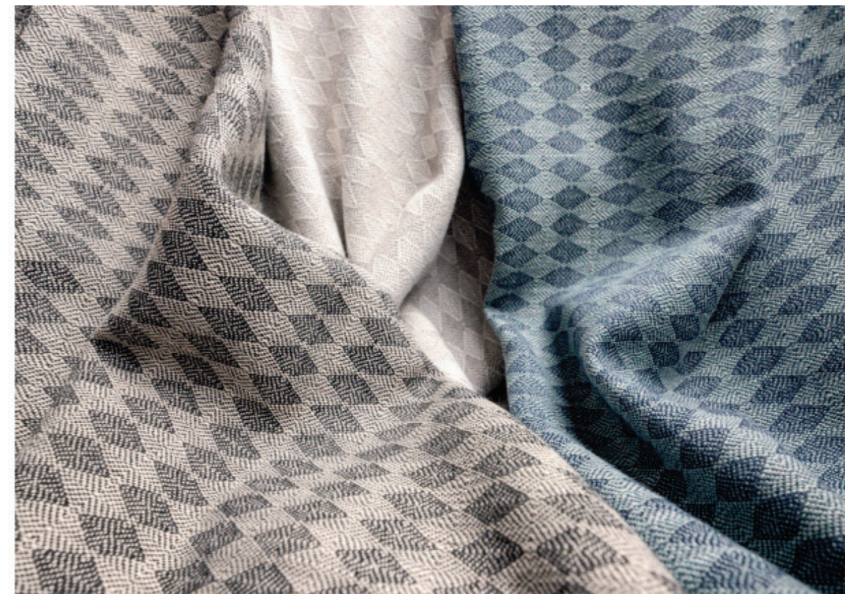
TEMPOTEST, CAPSTONE Tessuto per utilizzo indoor e outdoor in fibra Tempotest Home LS , idrorepellente, oleo removibile, resistente alla formazione di funghi e muffe, alla salsedine e allo scolorimento dovuto alle radiazioni solari. Cm 145. • Fabric for indoor and outdoor use in Tempotest Home LS fibre, which is water-repellent, oil-removable, and resistant to fungal and mould formation, salt and sun fading. 145 cm. para.it