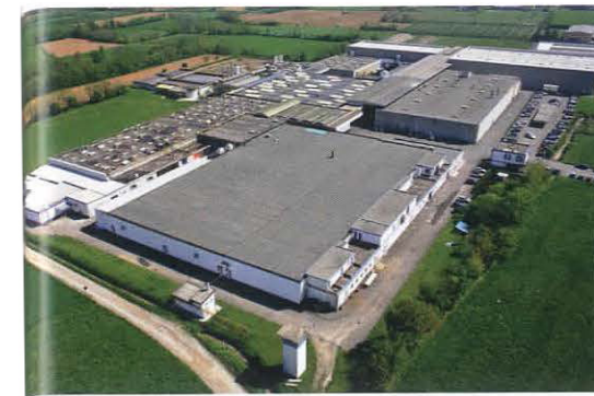
Einige Mitarbeiter im Werk in Pontirolo arbeiten schon in der dritten Generation für die Firma.

Der Markisentuchhersteller vertreibt seine Produkte weltweit. Dabei sei Italien einer der wichtigsten Märkte für das Unternehmen. Aber auch auf Deutschland, die Schweiz, Österreich, Benelux und Skandinavien – sprich Märkte in Europa – setzt das Unternehmen. Und nicht nur das: In den Vereinigten Staaten ist Parà mit eigenem Branding Tempotest USA im Markt vertreten. Durch die globalen Aktivitäten bekommt die Firma auch weltweit die Trends der Sonnenschutzbranche mit. „Seit einigen Jahren haben wir einen Trend zur vertikalen Verschattung, sprich: allem, was von oben nach unten fährt“, sagt Kratz. „Deswegen haben wir