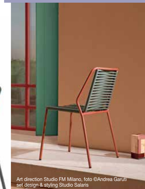
Art direction Studio FM Milano, foto ©Andrea Garuti set design & styling Studio Salaris