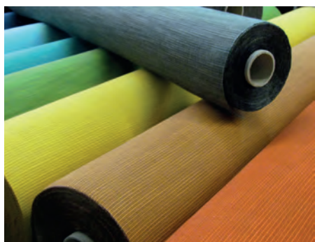
Ottomano - Collezione Struttura Plus