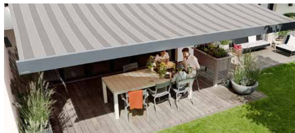
Tempotest Starlight blue werd ontwikkeld in samenwerking met weinor.